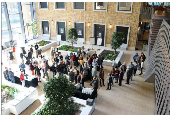
Deelnemers aan het "Gebruik van de IPBES aanbevelingen in België" in het Vlaams Instituut Natuur- en Bosonderzoek (INBO) op 1 oktober 2018.